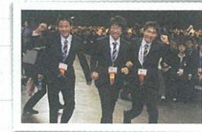
世界大会での表彰に思わずガッツポーズ!