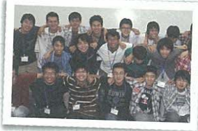
日本中の仲間と出会えた夏季セミナー (日本情報オリンピック)