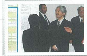
秋篠宮殿下のご内覧の様子 (日本学生科学賞)