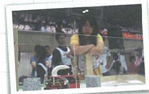
ロボットの動きを見守る真剣なまなざし (ロボカップジュニア)