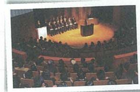
晴れがましい表彰式の舞台 (日本学生科学賞)