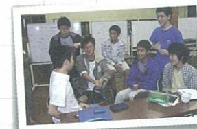
夏季セミナーの休み時間。みんな和やかな表情 (日本数学オリンピック)