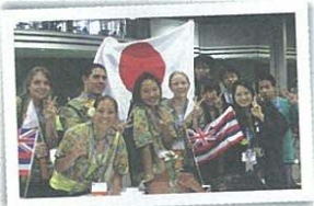
国際交流のひとコマ。世界中の高校生とバチリ (JSEC/ISEF)