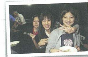
夏季セミナーの夕食はみんなでバーベキュー (日本数学オリンピック)